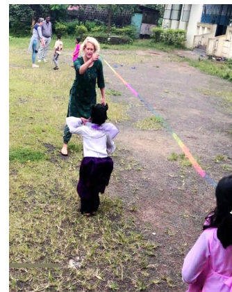
Abbildung 4: Das Team beim Spiel mit den Kindern aus dem Kinderdorf Agape Village.

Der Monsun fordert die Menschen in Mumbai jedes Jahr besonders heraus. Bahnsteige werden zu Wasserfällen, der Verkehr kommt zum Erliegen und vor allem die wohnungslosen Menschen und Menschen in den Slums müssen zusehen, wie sie trocken bleiben können. Krankheitserreger breiten sich in dieser Zeit mühelos aus. Imcares versorgt seine KlientInnen mit Regenplanen, Decken, Handtüchern und warmen Mahlzeiten.