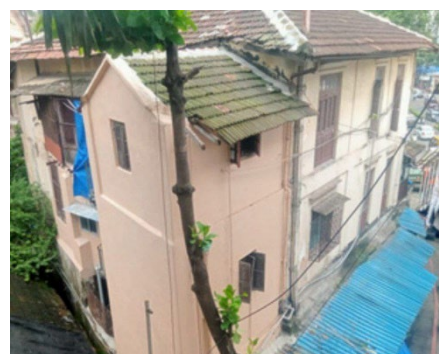
Abbildung 6: Die Fassade des Standorts Mumbai wurde teilerneuert.

Im Juni 2025 wurde auch das Gebäude von Imcares in Mumbai stark durch den Regen geschädigt. Aufwendige Reparaturarbeiten im Innen- und Außenbereich konnten durch eine private Einzelspende aus Deutschland finanziert werden. Seek and Care e.V. nahm den Bedarf auf und koordinierte die Spendenverteilung. Im Oktober 2025 wurden die baulichen Veränderungen durch ein Vorstandsmitglied begutachtet und dokumentiert, um die zweckmäßige Mittelverwendung nachzuvollziehen.