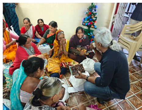
Abbildung 8: Weihnachtsfeier im Projekt Aji in Pune.

Mit unserem Programm des Interkulturellen Therapeuten Austausches (ITHA) senden wir medizinisches oder pädagogisches Fachpersonal nach Mumbai aus, um die Mitarbeitenden von Imcares in Theorie und Praxis zu unterstützen. Die europäischen TherapeutInnen und PädagogInnen profitieren von den fachlichen und kulturellen Erfahrungen. Es ist ein Austausch auf Augenhöhe. Finanziert wird das Programm durch private Mittel des Fachpersonals, sowie durch einen Spendentopf von Seek an Care e.V., siehe Punkt 6, Finanzbericht. Wir unterstützen hier intensiv in der Vorbereitung auf die bevorstehende neue Umgebung, Kultur und die Aufgaben. Wir betreuen das Fachpersonal während ihres Aufenthaltes durch online Meetings und stehen bei Fragen und Unklarheiten auch jederzeit im Chat zur Verfügung.