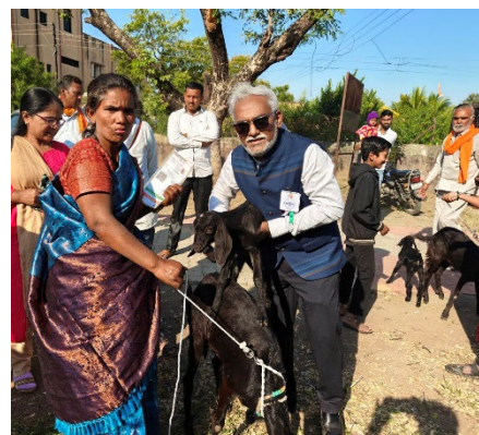
Abbildung 7: Übergabe der Ziegen im Fluthilfeprojekt.

20 Frauen erhielten je eine Jungziege als Start ihrer neuen Herde. Nachdem die Ziegen das erste Mal Nachwuchs zur Welt bekommen haben, soll je ein Zicklein an eine andere bedürftige Frau gegeben werden. So wird das Geschenk von Jahr zu Jahr weitergegeben und die Zahl der Begünstigten wird immer größer (Modell pass-on-the-gift ). An die Ziegenhaltung gekoppelt ist ein Seminar zur Ziegenhaltung durch einen Tierarzt. Die Jungziegen wurden bewusst in der Re-