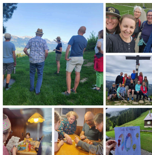
Abbildung 2: Vereinsjubiläum Seek and Care e.V.

Seek & Care e.V. durfte in diesem Jahr seinen 10. Geburtstag feiern! Es war uns allen eine besondere Freude, gemeinsam auf die vergangenen Jahre und ihre Entwicklung zurück zu blicken. Ein gemeinsames Wochenende im Mai 2025 auf der Kahrückenalpe im schönen Allgäu ermöglichte uns persönlichen, tiefen und vereinsbezogenen Austausch. Wir konnten auf Wanderungen, interaktiven Spielen, beim Essen und in Gesprächen näher zusammenrücken und unseren Teamgeist stärken. Fünfzehn Personen nahmen an diesem Wochenende teil und freuen sich bereits auf eine Wiederholung zu unserem 15-jährigen Jubiläum. Finanziert wurde das Wochenende über private Mittel der Teilnehmenden.