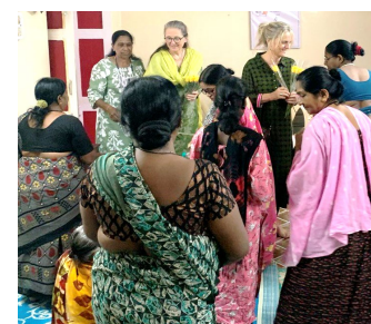
Abbildung 5: Das Team besucht das Projekt Aji.