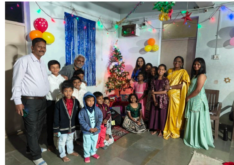
Abbildung 9: Weihnachtsfeier im Projekt Agape Village in Pune.