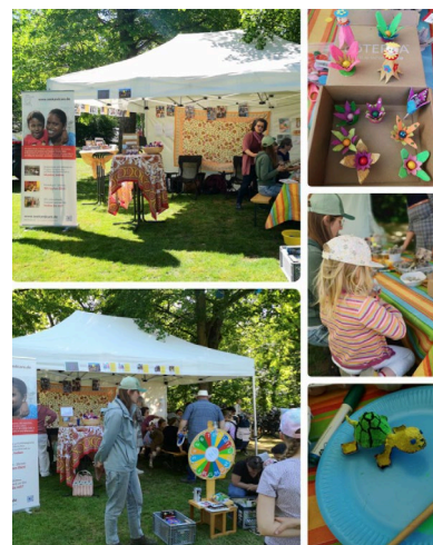
Abbildung 3: Seek and Care e.V. bei den AOK Familientagen.

Im Mai 2025 konnte Seek & Care e.V. zu den AOK Familientagen in Bamberg erneut einen bunten Stand anbieten und über die Vereinsarbeit berichten. Kreative Bastelangebote und unser Glücksrad begeisterten die Kleinen, während die Großen sich über ein Video und persönliche Gespräche über unsere Arbeit informieren konnten. Auf der Bühne sprachen wir über die Möglichkeit einen Freiwilligendienst in Indien zu leisten. Hier gelingen interkultureller Austausch und interkulturelles Verständnis. Vielen Dank an die beteiligten Vereinsmitglieder und Helfenden, die die Vorbereitung und Umsetzung übernommen haben.